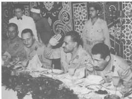
عبد الناصر وعامر في أحد السراقات